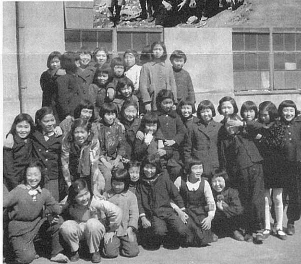
戦災で焼け残った校舎をバックに(昭和21年)