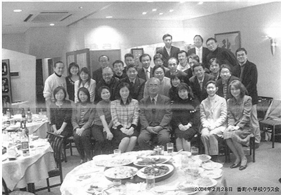
2004年2月28日 番町小学校クラス会

もいました! 番町小の友達は、みな気持ちのよい人ばかりです。いつまでも楽しい仲間でありたいと切に願い、また元気で会える日を心待ちにしております。