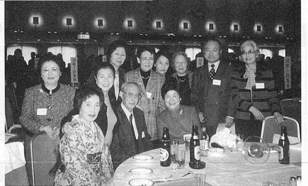
130周年記念総会・懇談会にて (平成13年12月1日)